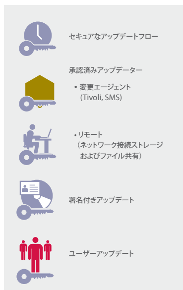
セキュアなアップデートフロー

McAfee Application Controlは動的な信頼モデルを活用するため、IT管理者は、承認済みアプリケーションのリストを手作業で管理する必要がなくなります。承認済みのソフトウェアだけが実行を許可され、承認済みソフトウェアを改ざんすることはできません。