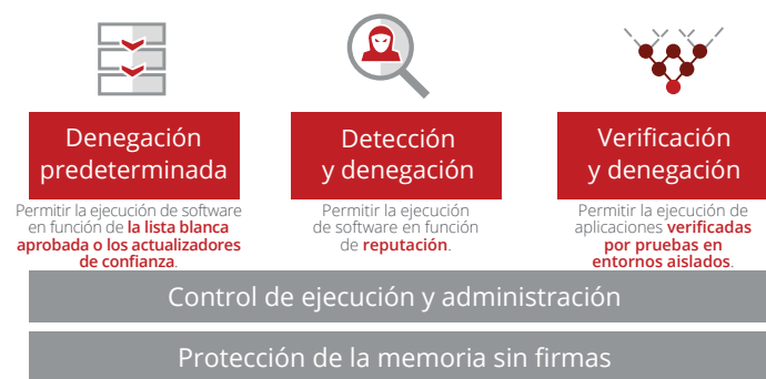
Figura 1. Tres formas de maximizar la estrategia de listas blancas.