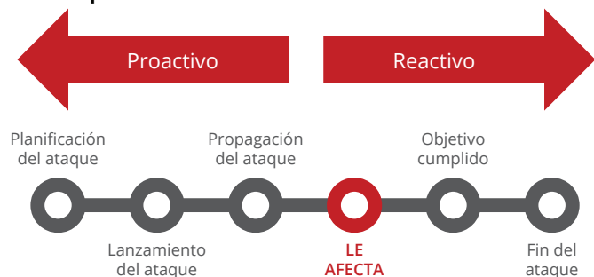
Figura 1. Ciclo de vida de un ataque típico.

A fin de cuentas, la inteligencia y la información procesable le ofrecen la mejor medida de ciberseguridad posible frente a las amenazas más probables y aumentan su confianza en las defensas dispuestas. Así es cómo McAfee MVISION Insights lo consigue: