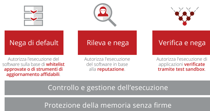
Figura 1. Tre modi per sfruttare al massimo la strategia relativa alle whitelist.