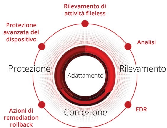
Figura 5. Contromisure integrate nell'intero ciclo di vita delle difese.

McAfee offre un'ampia gamma di contromisure integrate nell'intero ciclo di vita della difesa dalle minacce per combattere attacchi fileless, zero-day e basati sul malware. Da un generale rafforzamento dei dispositivi fino all'analisi avanzata dei comportamenti, alla protezione contro il furto delle credenziali e al rilevamento e risposta per gli endpoint (EDR), puoi allestire una difesa collettiva a partire da una sola soluzione senza la fatica di dover gestire numerosi prodotti.