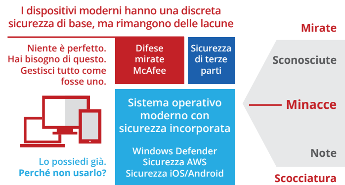
Figura 3. Sfrutta, rinforza e gestisci la solida sicurezza di base già integrata in Microsoft Windows 10.

La protezione integrata e già esistente negli ultimi sistemi operativi Microsoft Windows viene potenziata per ottenere una reale difesa di livello enterprise, e senza richiedere una console di sicurezza aggiuntiva. Si ottiene così una difesa collettiva più ampia con un minor impegno gestionale.