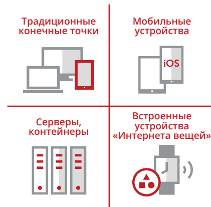
Рис. 4. Выполняйте управление устройствами всех типов с помощью единой консоли.

Ваша организация работает не только с традиционными конечными точками на базе ОС. Вам необходимы единая точка сбора и анализа данных и контроля конечных точек, серверов, виртуальных экземпляров, контейнеров, встроенных устройств «Интернета вещей» и мобильных устройств. Управлять ими следует как «любым другим устройством», а не как совершенно отдельными объектами.