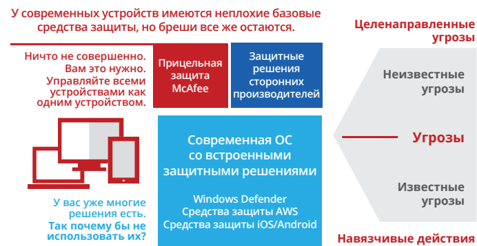
Рис. 3. Используйте и усиливайте надежную базу средств защиты, уже встроенных в Microsoft Windows 10, а также управляйте ею.

Используйте встроенные защитные механизмы, уже имеющиеся в последней операционной системе Microsoft Windows, и усильте их, обеспечивая тем самым подлинную защиту корпоративного класса без необходимости задействовать дополнительную консоль управления безопасностью. Вы создадите расширенную коллективную защиту, уменьшив бремя управления.