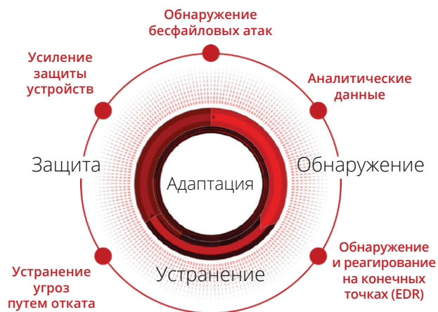
Рис. 5. Комплексные контрмеры на протяжении всего жизненного цикла обеспечения защиты.

McAfee предоставляет широкий спектр комплексных контрмер для всего жизненного цикла защиты от угроз, направленный на отражение атак с использованием бесфайлового вредоносного ПО, уязвимостей «нулевого дня» и вредоносных программ. За счет общего усиления защиты устройств и повышения их «гигиены», передового анализа поведения, защиты от краж учетных данных, обнаружения угроз и реагирования на инциденты на конечных точках (EDR) вы сможете создать коллективную защиту на основе единого решения, избавившись от дублирующей ручной работы по обеспечению безопасности.