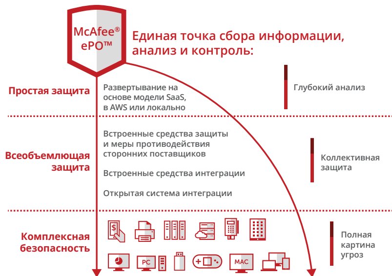
Рис. 1. McAfee Device Security предлагает простой, всеобъемлющий и комплексный подход к защите вашего цифрового мира.

Возможность выбора между разными вариантами управления, такими как «программное обеспечение как услуга» (SaaS), виртуальное или локальное управление, а также единая интуитивно понятная