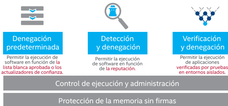
Figura 1. Tres formas de maximizar la estrategia de listas blancas.