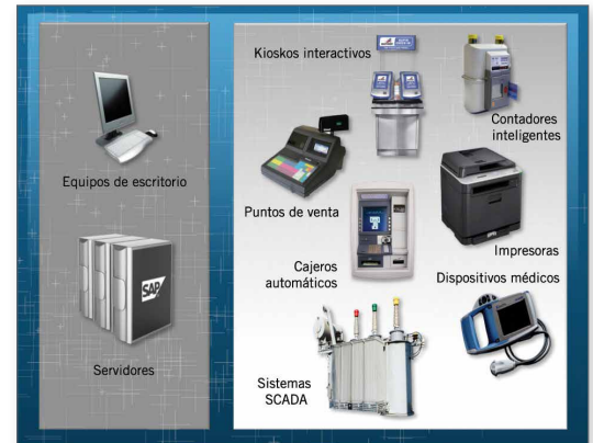
Figura 4. Además de los equipos de escritorio, el software McAfee Application Control puede proteger los servidores y dispositivos con una función específica para reducir significativamente el riesgo para una amplia variedad de aplicaciones.

El software McAfee ePO consolida y centraliza la administración, proporcionando de esta forma una visión global de la seguridad de la empresa, sin ángulos muertos. Esta eficaz plataforma de administración de la seguridad integra el software McAfee Application Control for Desktops con McAfee Host Intrusion Prevention, McAfee Firewall y otras soluciones de seguridad y gestión de riesgos de McAfee. Además, el software McAfee ePO puede integrar fácilmente soluciones de partners del programa McAfee Security Innovation Alliance, así como soluciones internas de administración de aplicaciones.