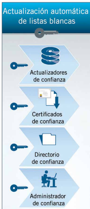
Figura 2. Flujo de actualizaciones seguro.

Plataformas admitidas Microsoft Windows XP, Windows Vista y Windows 7