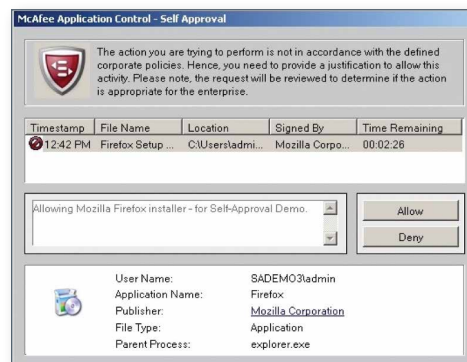
Figura 3. Los usuarios que intentan instalar aplicaciones que no han sido aprobadas verán un cuadro de solicitud de autoaprobación, con una notificación de que su solicitud está a la espera de la aprobación por parte de TI. Tras la aprobación, las aplicaciones se añaden fácilmente a la lista blanca, para evitar otras solicitudes en el futuro.

Este departamento TI inspecciona las autoaprobaciones y crea directivas para toda la empresa destinadas a prohibir o permitir el uso de la aplicación en todos los sistemas. Los usuarios que no pueden realizar la autoaprobación recibirán un mensaje informativo en el que se explica por qué no tienen acceso a aplicaciones no autorizadas. Estos mensajes invitan a los usuarios a solicitar la aprobación por correo electrónico o a través de los centros de asistencia.