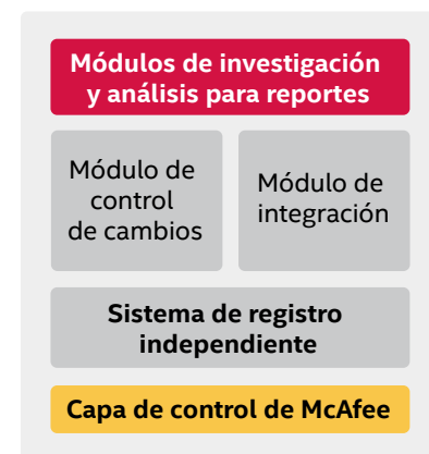
Agente de cambios desplegado en los endpoints

El módulo supervisor del sistema administra la comunicación entre el controlador del sistema y los agentes. Agrega y guarda la información de los cambios procedente de los agentes en el sistema de registro independiente.