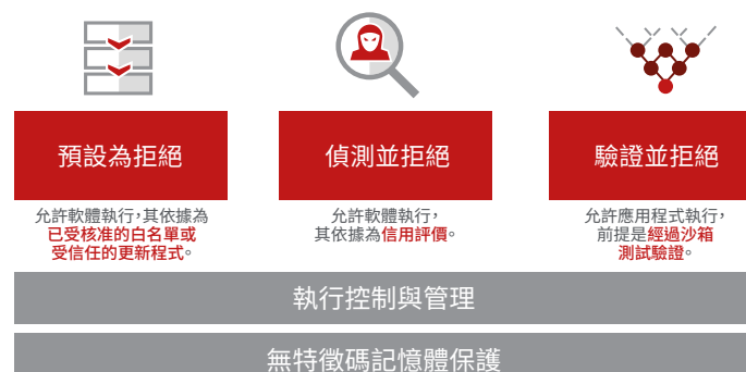
圖 1. 充分發揮白名單策略的三種方法。

由於使用者要求在社交與啟用雲端的企業環境中使用應用程式時須更具彈性，McAfee Application Control 提供組織三種充分發揮白名單策略的選項，以達到以上所述之威脅防護目標：